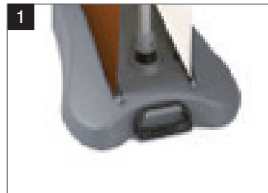
1) Für In- und Outdoor

Mehr Informationen und Formatvorlagen zum downloaden finden Sie nachdem Sie Ihr Produkt konfiguriert haben unter dem Punkt „Formatvorlagen-Downloads“ bei „Ihr gewähltes Produkt“.